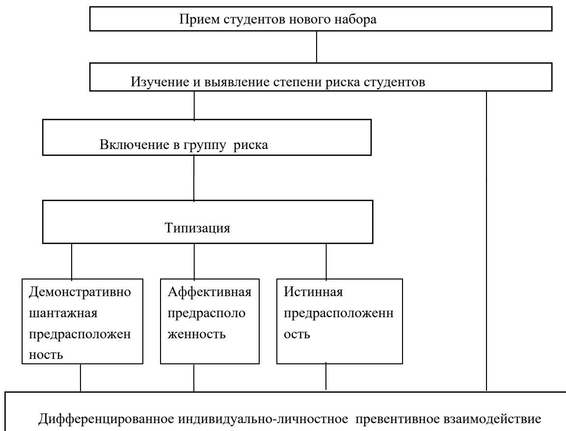
Рис. 2 Алгоритм превентивной деятельности руководителя группы по психолого-педагогической профилактике